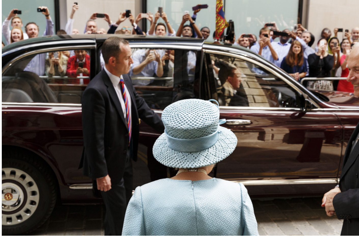
Martin Parr, La Regina in visita in occasione del 650° anniversario della Worshipful Company of Drapers . Inghilterra, Londra, Drapers' Livery Hall, 2014. Da "Establishment"

Attraverso un percorso dentro i progetti più noti, l'inedito stile documentario che da oltre cinquant'anni caratterizza il linguaggio del fotografo inglese Martin Parr diventa cartina tornasole per osservare la società contemporanea e le sue pieghe più contraddittorie , quelle che appartengono al mondo occidentale, in particolare europeo, restituito da una cronaca fotografica tagliente, senza filtri e fuori dalla retorica, a volte raccontata con pungente sarcasmo; più spesso presentata con ironia e umorismo. Le immagini di Parr catturano momenti comici o inaspettati, offrendo uno sguardo critico ma anche divertente sulla vita quotidiana di tutti noi.