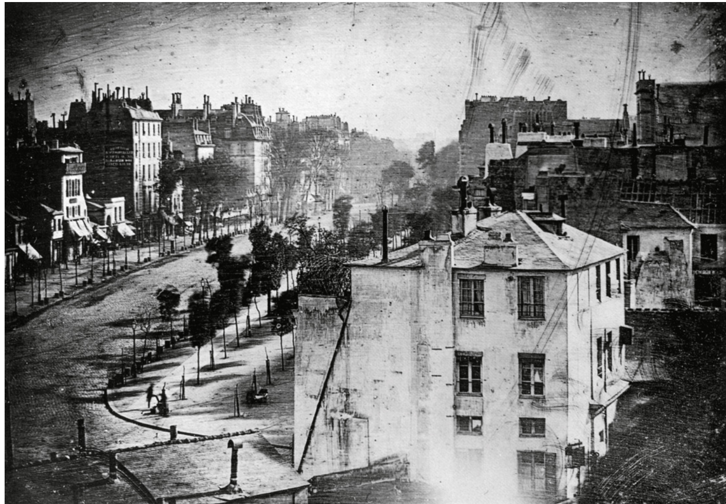
Daguerre, Boulevard du Temple, 1839. © Louis-Jacques-Mandé Daguerre / pubblico dominio

Prodotta da 24 ORE Cultura – Gruppo Il Sole 24 ORE , sponsorizzata da Zurich come Main Sponsor e Turisanda1924 – brand di viaggi di Alpitour World come Sponsor, il progetto conferma il MUDEC come luogo di comprensione delle culture attraverso l'immagine, offrendo al pubblico l'opportunità di guardare il mondo con occhi nuovi.