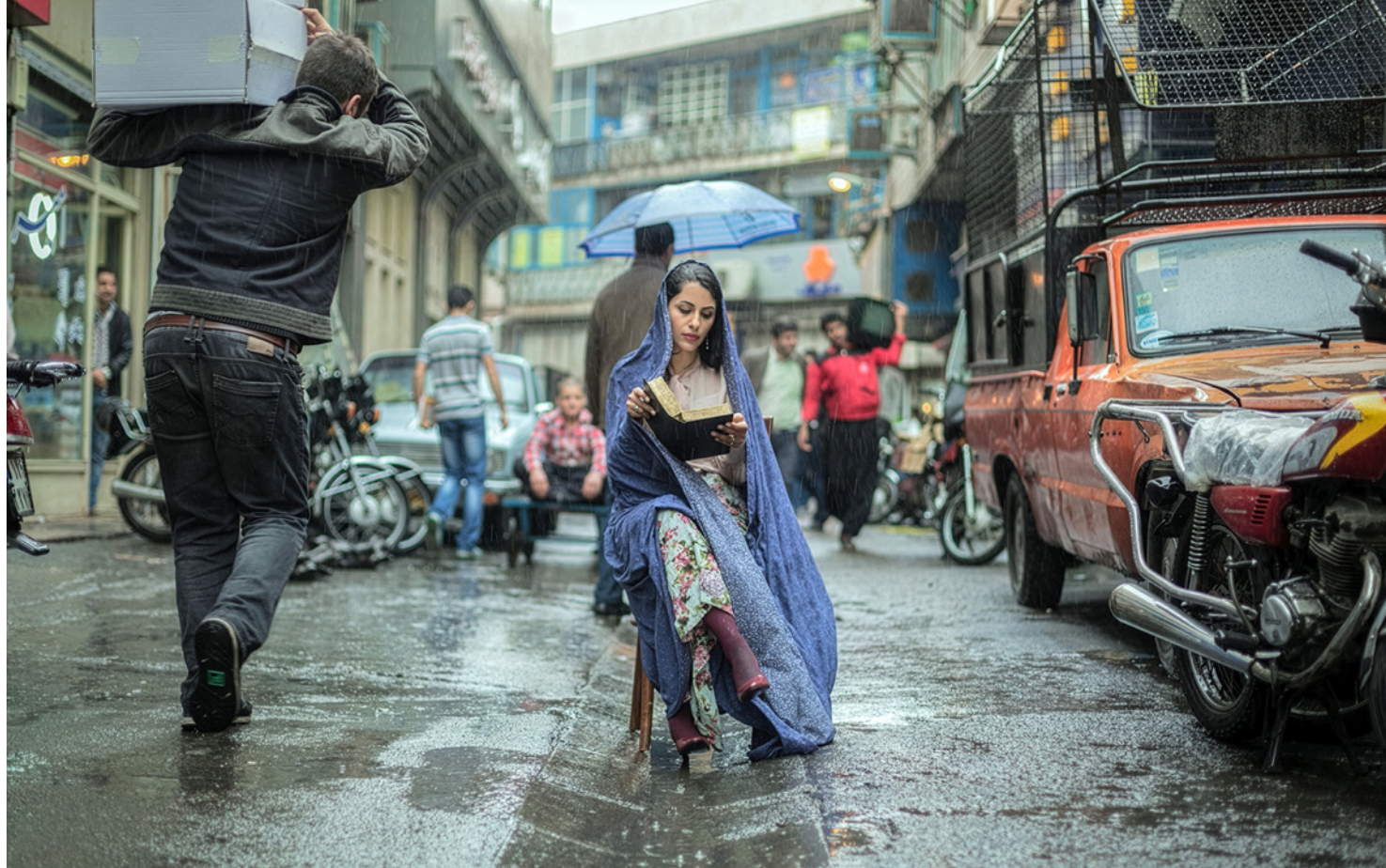
Maryam Fuzai, Reading on Tehran Streets, 2017, Courtesy of Pier Luigi Gbali

La fotografia è un linguaggio che custodisce il mondo: conserva la memoria, rivela le trasformazioni, restituisce ferite, rinascite, cambiamenti e speranze. È uno strumento capace di raccontare ciò che siamo stati, ciò che saremo e ciò che possiamo diventare.